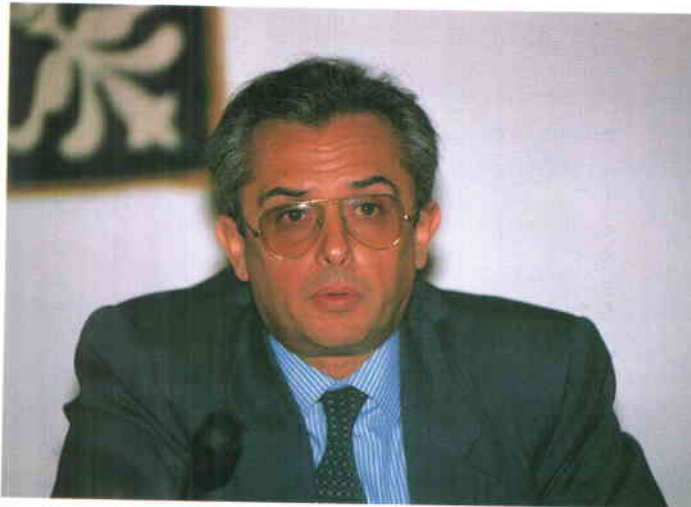
El Magistrado Juez de la Audiencia Nacional, Carlos Bueren (a la izquierda), y el Fiscal General del Estado, Eligio Hernández, durante su intervención en el último de los cursos.

En su intervención, Carlos Bueren calificó la delincuencia como un fenómeno fundamentalmente urbano en cuyo control resulta fundamental la colaboración ciudadana, especialmente en lo referido a investigación y localización de los