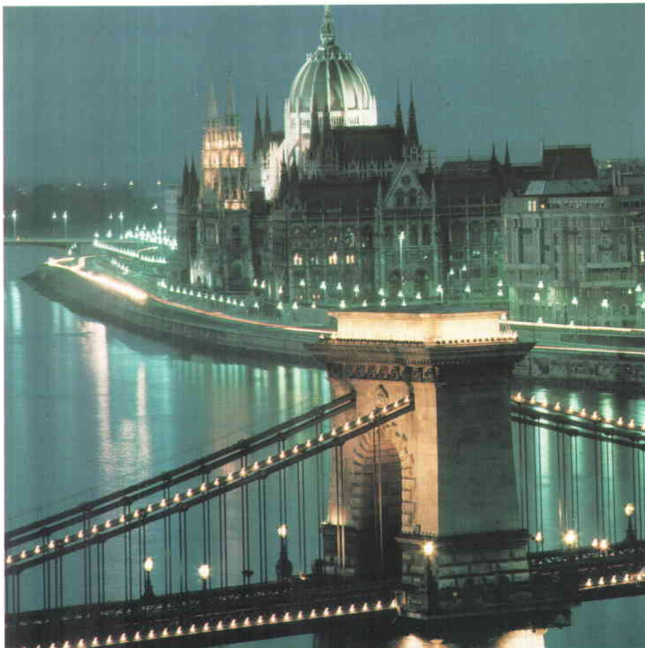
Las Administraciones Locales húngaras tienen total dependencia financiera del Gobierno Central. En la fotografía, la sede del Parlamento, en Budapest.

– Fue el resorte gubernamental el que permitió la organización de una representación unificada de las Asociaciones de Administraciones Locales Húngaras para el CMRE. Durante el primer año de pertenencia, la financiación de los viajes fue muy difícil para nuestra Sección y fueron los propios Alcaldes los que tuvieron que sufragar sus viajes. En este aspecto, de cara al futuro, nuestra tarea más importante será la organización del pago de las cotizaciones y la organización de una representación permanente. Hasta el momento de ser elegido Presidente, yo mismo me encargaba de organizar la administración, aunque ahora sería necesario un encargado permanente de esta misión que pudiera realizar un