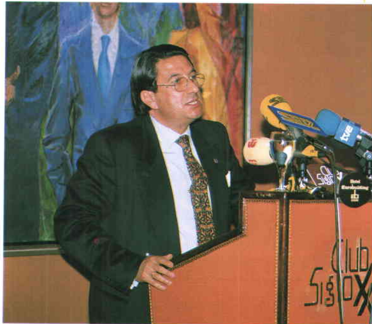
Todos hemos hecho el esfuerzo de crear Comunidades Autónomas que ahora deben funcionar y predicar con el ejemplo descentralizador en sus territorios.

Pero siempre, y esto es lo importante, en una doble dirección, solucionar los problemas históricos de las nacionalidades y a la vez profundizar en la democratización descentralizando y acercando más al ciudadano los órganos de decisión y control. Lo contrario hubiera sido romper el modelo de Estado y suprimir los controles de solidaridad y equilibrio territorial, sin los cuales España como tal no tendría sentido.